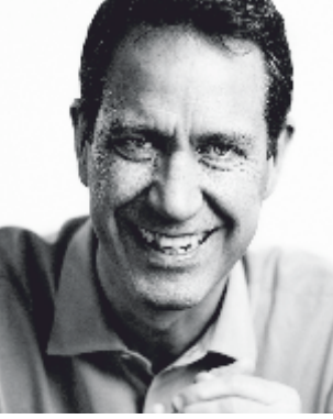
Russell Longmuir CEO, EFQM

EFQM Modeli 30 yılı aşkın süredir dünyanın en yaygın kullanılan yönetim çerçevesidir. 2019 yılında, EFQM Modelini, gelecek 10 yılın dönüşümüne, teknolojik gelişmelere, kültür değişikliğine ve yeniliklere hazır ve amacına uygun hale getirmek için gözden geçirdik ve dönüştürdük. EFQM Modeli el kitabının bu baskısında, paydaşların nasıl ele alınması ve değerlendirilmesi gerektiği konusunda kullanıcılara netlik kazandırabilmeye yönelik bazı küçük değişiklikler yapmak için model kılavuzunu değerlendirme ve iyileştirme fırsatı bulduk.